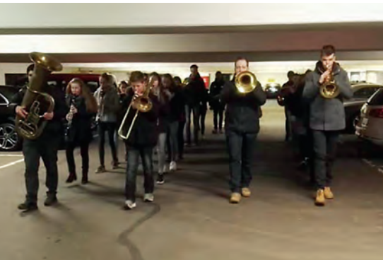
Marschprobe in der Tiefgarage

Fotos oben: Promenadenkonzert 2018, in Genf beim Besuch der Partnerstadt Wehrs Onex 2017